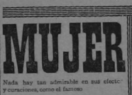
Nada hay tan admirable en sus efectos y curaciones, como el famoso